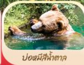
ป้อมีสีน้ำตา