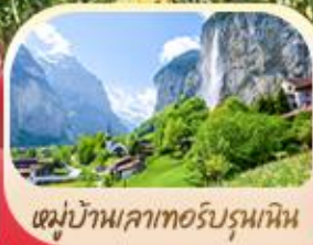
หมู่บ้านเลาเทอร์บรุนเนน