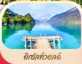
อีเซลท์วอลด์