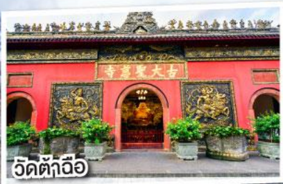
วัดต้าอ้อ