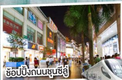
ช้อปปิ้งถนนชุนชี่