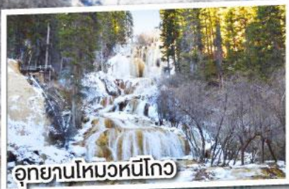
อุทยานโหมวหนีโกว