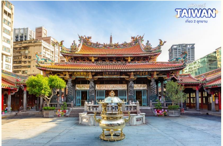
บริษัท TAIWAN เที่ยว 2 อุทยาน

เป็นหนึ่งในวัดที่เก่าแก่และมีชื่อเสียงมากที่สุดแห่งหนึ่งของเมืองไทเป เพื่อเป็นสถานที่สักการะบูชาสิ่งศักดิ์สิทธิ์ตามความเชื่อของชาวจีน ที่เชื่อกันว่าเป็นเทพผู้ผูกด้ายแดงให้สมหวังด้านความรัก จนบางคนเรียกกันว่าเป็นวัดสไต้ได้หัววัน ทำให้ที่นี่เป็นอีกหนึ่งแหล่งท่องเที่ยวไม่ควรพลาดของเมือง