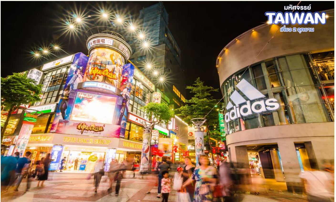
มหัศจรรย์ TAIWAN เที่ยว 2 อุทยาน