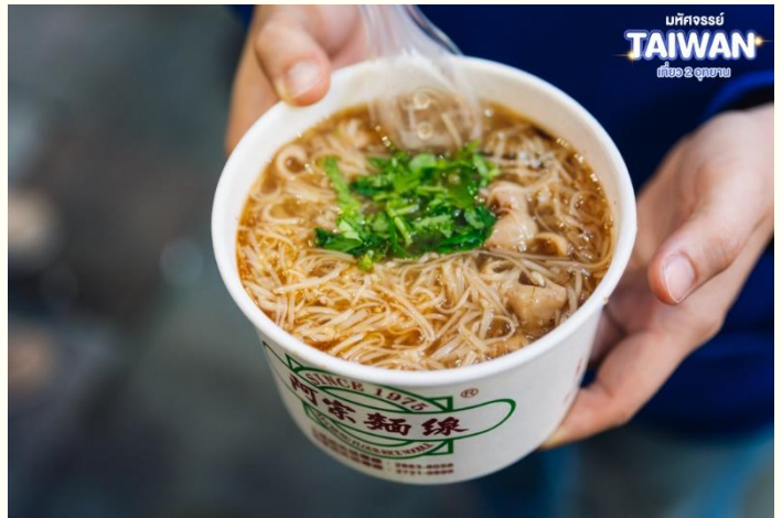
มหัศจรรย์ TAIWAN เที่ยว 2 อุทยาน