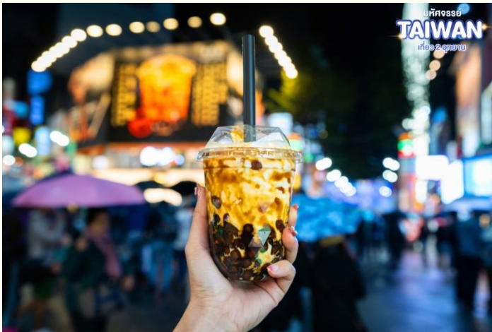
มหัศจรรย์ TAIWAN เที่ยว 2 อุทยาน