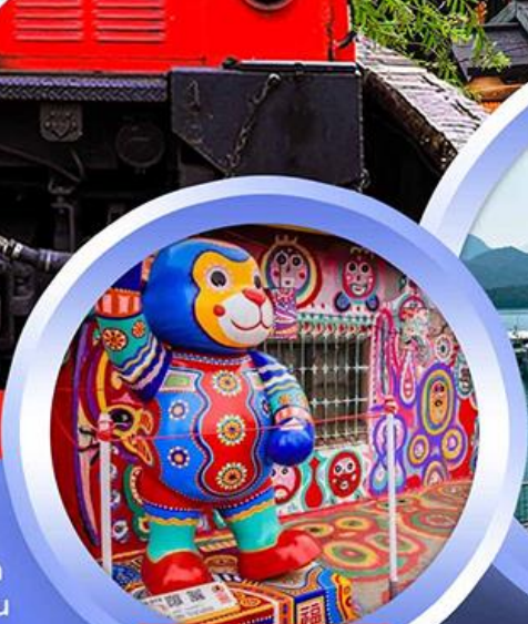
หมู่บ้านสายรุ้ง