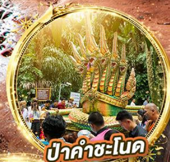
ปากคำชะโนด