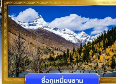
ชื่อกุเหนียงชาน