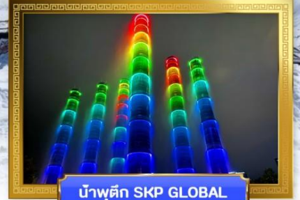
น้ำพุตึก SKP GLOBAL