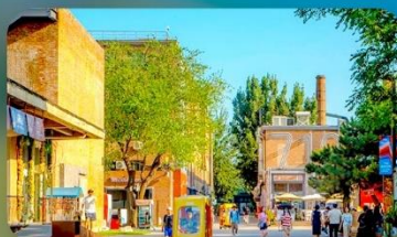
798 Art District