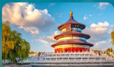
หอสักการะฟ้าเทียนถาน