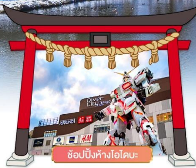
ช้อปบิงห้างไอโดบะ