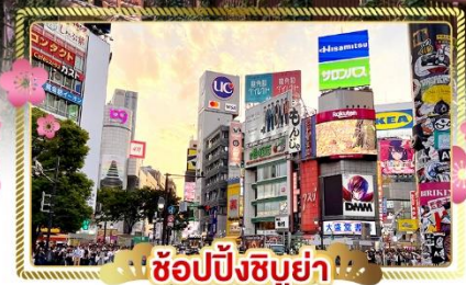
ช้อปปิ้งชิบูย่า