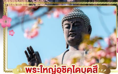
พระใหญ่อุซึคุโอบุตสึ