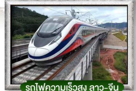
รถไฟความเร็วสูง ลาว-จีน