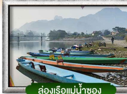
ล่องเรือแม่น้ำซอง