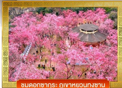
ชมดอกซากุระ ภูเขาหยวนกงซาน