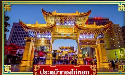
ประตูน้ำทองโก๋หยก