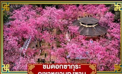
ชมดอกซากุระ ภูเขาหยวนกงซาน