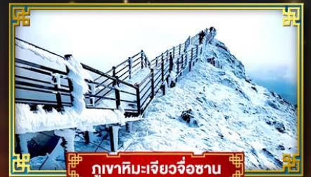
ภูเขาหิมะเจียวจื่อซาน