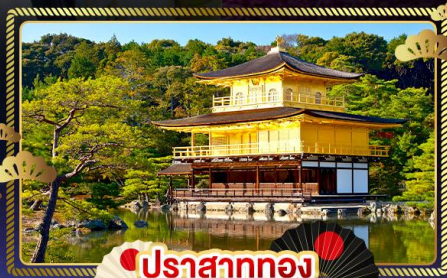
ปราสาททอง