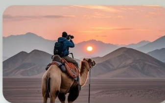
ทะเลทรายทากลามากัน