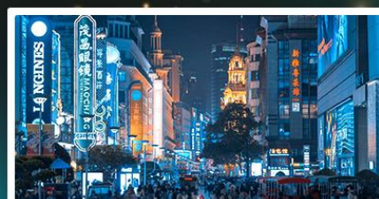
ป่าเปลี่ยนสีทะเลสาบชิงชาน