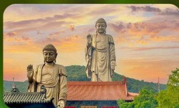
พระใหญ่หลิงชาน