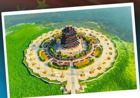
วัดหลงหยวน