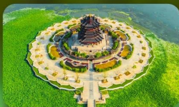
วัดฉงหยวน