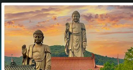
พระใหญ่หลิงซาน