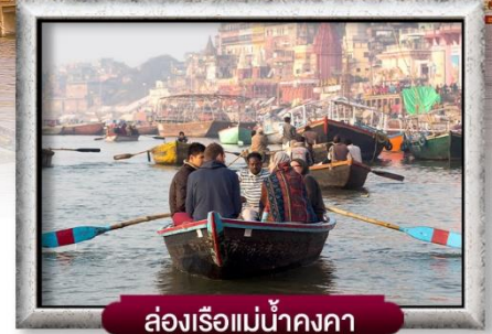
ล่องเรือแม่น้ำคงคา