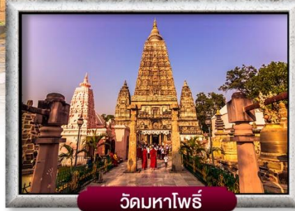
วัดมหาโพธิ์