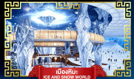
เมืองหิมะ ICE AND SNOW WORLD