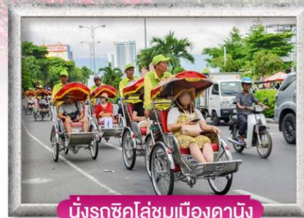
นั่งรถถีบไล่ชมเมืองดานัง