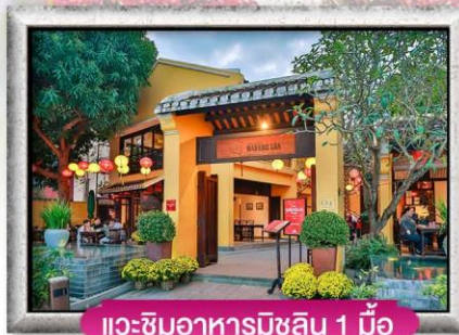
แวะชิมอาหารมิชลิน 1 มื้อ