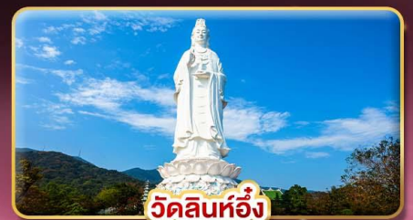
วัดลินห์อึ้ง