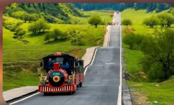
หุบเจานางฟ้า