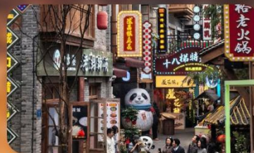
หมู่บ้านสี่ปาตี้