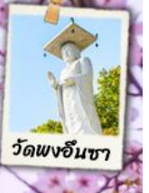
วัดพงอินซา