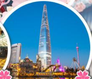
ลือตเต้ทาวเวอร์