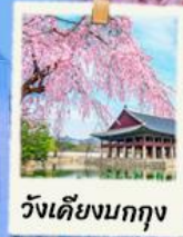
วังเคียงบกกุง