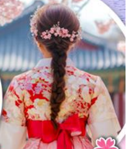
ใส่ชุดฮันบก

**การบานของดอกซากุระขึ้นอยู่กับสภาพอากาศ**