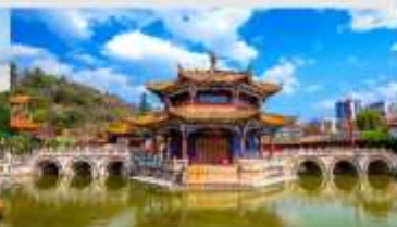
วัดหยวนกง