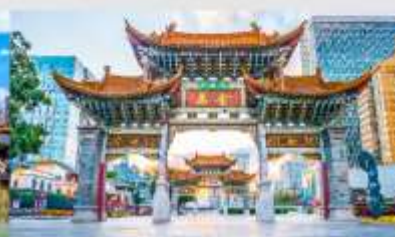
ประตูม้าทอง ไถ่หยก