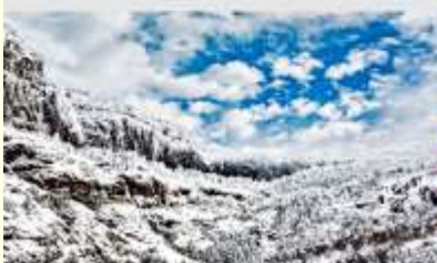
ภูเขาหิมะเจี๋ยจื่อ