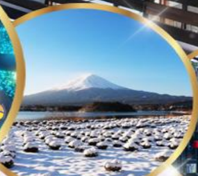
สวน โออิชิ พาร์ค