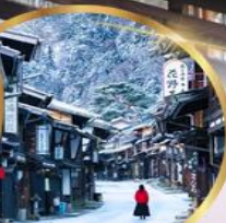
หมู่บ้านโบราณ นาราอิ จุกุ