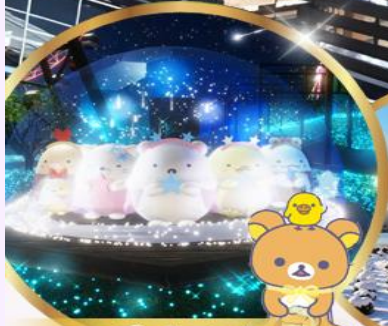
ซากามิโกะ อิลลูมินาเลี่ยน ธันตาร์ตอนสุดน่ารักจากค่าย SAN-X