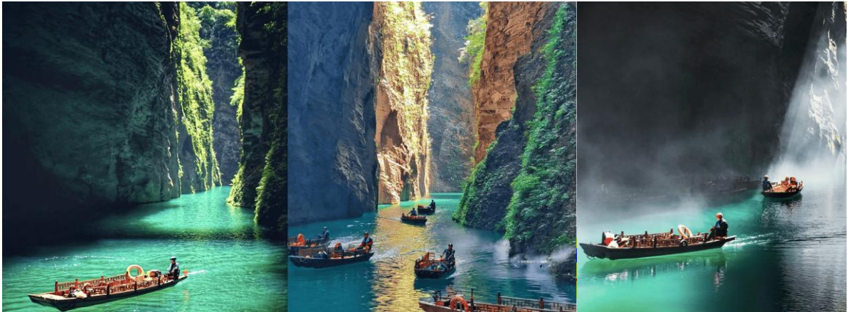
ทิวทัศน์

หลังจากนั้นนำทุกท่านเดินทางสู่ "แกรนด์แคนยอนผิงซาน" (Pingshan Grand Canyon) (รวมรถอุทยาน+ค่าล่องเรือไป-กลับ) (ใช้เวลาเดินทางประมาณ 3 ชั่วโมง) ตั้งอยู่ในเมืองเอินซือ ขึ้นชื่อเรื่องทิวทัศน์หุบเขาหินทรายสีแดงและแม่น้ำที่ใสสะอาดที่สุดแห่งหนึ่ง ไฮไลท์คือการล่องเรือชมวิวน้ำฟ้าสูงชันและน้ำที่สะท้อนเงาภูเขาจนดูเหมือนเรือลอยอยู่บนอากาศ เป็นสถานที่ท่องเที่ยวทางธรรมชาติระดับ AAAA หลังจากนั้นนำทุกท่านล่องเรือชมความงามของแกรนด์แคนยอนผิงซาน (รวมรถอุทยาน+รวมค่าล่องเรือชมทัศนียภาพแกรนด์แคนยอน)