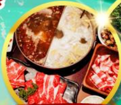
บุฟเฟต์ชาบู