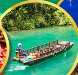
อุทยานผิงซาน แกรนด์แคนยอน