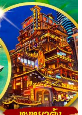
ตึกหยาดัง