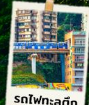
รถไฟฟ้าสุดึก