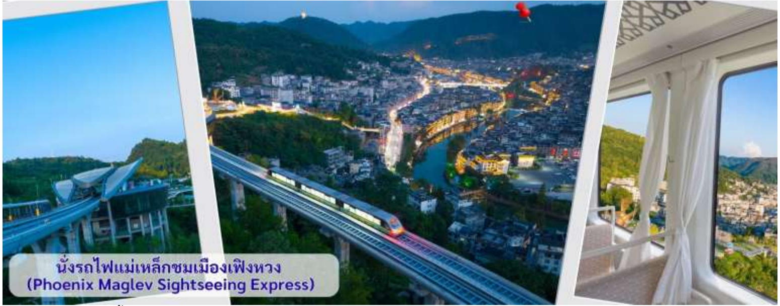
นั่งรถไฟแม่เหล็กชมเมืองเฟิงหวง (Phoenix Maglev Sightseeing Express)

จากนั้นนำทุกท่าน เดินถนนโบราณ Feng Hueng Ancient Town ที่ถนนชื้อปิ่น Shibian Street เมืองที่ยังคงรักษาเอกลักษณ์ความเป็นพื้นเมืองผสมผสานกับยุคปัจจุบันเอาไว้ได้อย่างลงตัววิถีชีวิตของชาวบ้านที่อาศัยอยู่ที่นี่ บรรยากาศในเมืองเฟิงหวง ถนนเก่าชื้อปิ่นเป็นถนนปูหินแคบๆ กว้างไม่ถึง 5 เมตร ทอดยาวจากทางเข้าวัดเต้าเหมินไปทางทิศตะวันตก ผ่านถนนหลายสาย ได้แก่ ถนนคอรอส ถนนเจิ้งตะวันออก ถนนเจิ้งตะวันตก ศาลาสูยหลง หียงเซียวซง เต้าซานลา ศาลาเจี้ยกัว และสุสานเซินฉงเหวิน สุดท้ายจะนำไปสู่ “น้ำพุแรกใต้ฟ้า” ถนนสายนี้มีความยาวกว่า 3,000 เมตร และเป็นย่านการค้าที่คึกคักที่สุดในเฟิงหวง