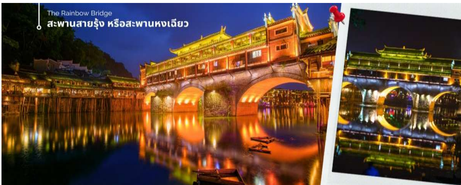
The Rainbow Bridge

นำท่านชม สะพานสายรุ้ง (The Rainbow Bridge) หรือสะพานหงเจียว เป็นสะพานไม้โบราณที่มีหลังคาคลุมเหมือนสะพานข้ามคลองในเวนิส ตั้งอยู่ในเมืองเฟิ่งหวาง จุดเด่นอีกแห่งหนึ่งที่อยู่ใกล้สะพานนี้ก็คือ บ้านบริเวณที่สะพานหงเจียว จยกพื้นสูงเรียงรายกันบนริมน้ำที่ใสสะอาดจนเห็นกันบึง ซึ่งเป็นทัศนียภาพที่สวยงาม ที่ทั้งชาวจีนและชาวต่างประเทศนิยมเดินทางมาเที่ยวชมที่นี่ ชมแสงสียามค่ำคืนของเมืองเก่า จุดไฮไลท์ที่ขึ้นชื่อของเมืองแห่งนี้