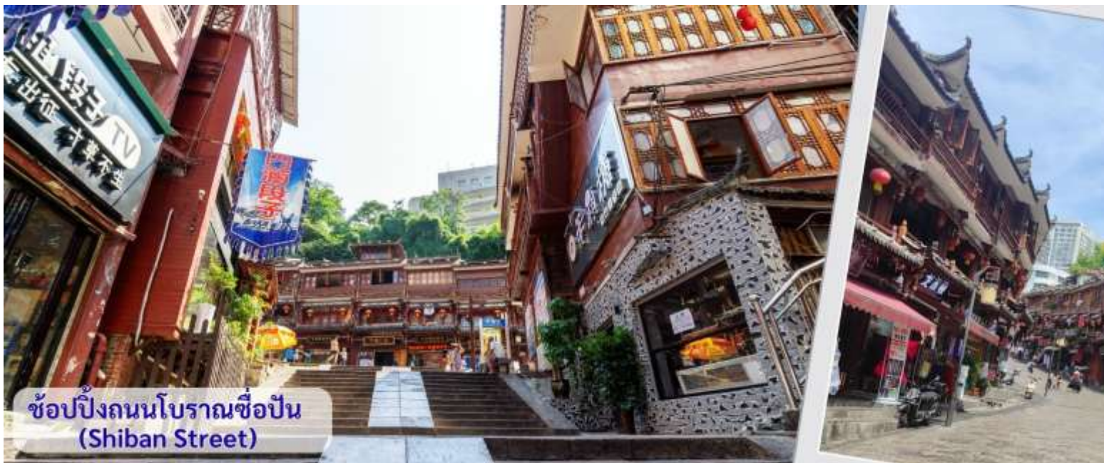
ช้อปปิ้งถนนโบราณชื้อปิ่น (Shibian Street)

จากนั้นนำทุกท่าน เดินถนนโบราณ Feng Hueng Ancient Town ที่ถนนชื้อปิ่น Shibian Street เมืองที่ยังคงรักษาเอกลักษณ์ความเป็นพื้นเมืองผสมผสานกับยุคปัจจุบันเอาไว้ได้อย่างลงตัววิถีชีวิตของชาวบ้านที่อาศัยอยู่ที่นี่ บรรยากาศในเมืองเฟิงหวง ถนนเก่าชื้อปิ่นเป็นถนนปูหินแคบๆ กว้างไม่ถึง 5 เมตร ทอดยาวจากทางเข้าวัดเต้าเหมินไปทางทิศตะวันตก ผ่านถนนหลายสาย ได้แก่ ถนนคอรอส ถนนเจิ้งตะวันออก ถนนเจิ้งตะวันตก ศาลาสูยหลง หียงเซียวซง เต้าซานลา ศาลาเจี้ยกัว และสุสานเซินฉงเหวิน สุดท้ายจะนำไปสู่ “น้ำพุแรกใต้ฟ้า” ถนนสายนี้มีความยาวกว่า 3,000 เมตร และเป็นย่านการค้าที่คึกคักที่สุดในเฟิงหวง