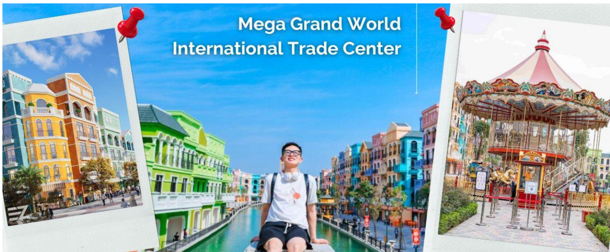
Mega Grand World International Trade Center

นำท่านออกเดินทางสู่ สถานที่ท่องเที่ยวแห่งใหม่ ของเมืองฮานอย ที่กำลังเป็นที่นิยมของนักท่องเที่ยวทั้งชาวต่างชาติและชาวเวียดนามเอง Mega Grand World International Trade Center ตั้งอยู่ใจกลางของภาคเหนือ และที่นี่ยังเป็นแหล่งรวมความบันเทิงที่ทันสมัยที่สุด เทียบพร้อมไปด้วยร้านช้อปปิ้งมากมาย จุดหมายปลายทางสำหรับนักท่องเที่ยวที่ต้องการสัมผัสวัฒนธรรม ศิลปะ สถาปัตยกรรมร่วมสมัยของเอเชีย - ยุโรป ที่ถ่ายทอดผ่านทางอาคารบ้านเรือน และการตกแต่งด้วยกลิ่นไอความเป็นอิตาเลียน ท่านจะได้เพลิดเพลินไปกับ ร้านค้ามากมาย ให้เลือกซื้อของฝาก ต่างๆ และเติมไปอิมไปด้วยมุมถ่ายรูปมากมาย ที่สามารถ ใช้เวลาเดินทาง ได้ตลอดทั้งวันไม่มีเบื่อ