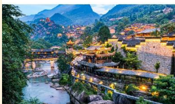
หุบเขาเทวดาฉางเซียนกู่