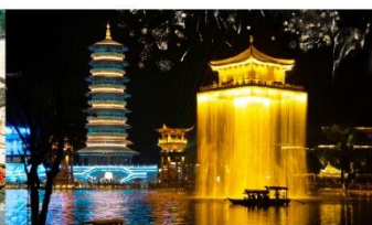
ล่องเรือฉู่หนี่โจว