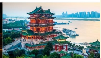
หอแดงหวัง