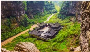
อุทยานหลุมฟ้าสะพานสวรรค์