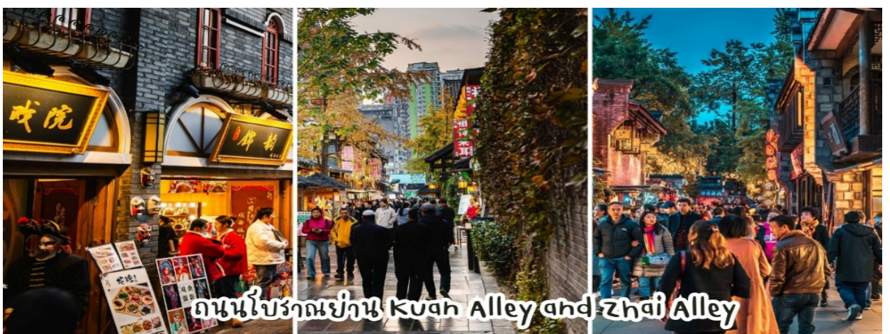
ถนนโบราณย่าน Kuan Alley and Zhai Alley

จากนั้นนำท่านเดินทาง ช้อปปิ้งชอยกว้างชอยแคบ เป็นถนนที่แสดงถึงเสน่ห์ของการตกแต่งด้วยเรื่องราววิถีชีวิตการเป็นอยู่ของคนจีนเฉิงตูในสมัยโบราณ ที่มีการผสมความเป็นทันสมัยเข้าไปอย่างลงตัว ถนนคนเดินมี 3 ซอย แต่ละซอยมีความยาวประมาณ 400 เมตร มีร้านค้าเล็กๆ ตั้งเรียงรายอยู่ในแต่ละซอยและตรอกให้เดินช้อปปิ้งเพลิน ทั้งร้านหนังสือ ร้านชา-กาแฟ บาร์ เสื้อผ้า ไปจนถึงร้านอาหารนานาชาติ มีจำหน่ายสินค้าพื้นเมือง ขนม ร้านอาหาร รวมทั้งของฝากให้ท่านได้ถ่ายรูปและเลือกซื้อ