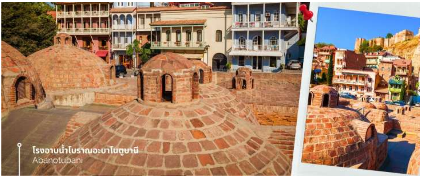
โรงอาบน้ำโบราณอะบาโนตูปานี Abanotubani

จากนั้นเดินทางสู่เมืองเก่าจอร์เจียมซเคตา