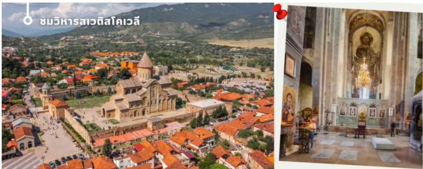
ชมวิหารสเวตีสโคเวลี

นำท่านออกเดินทางชม วิหารสเวตีสโคเวลี (Svetitskhoveli Cathedral) โบสถ์เก่าแก่ที่ถือเป็นศูนย์กลางทางศาสนาอันศักดิ์สิทธิ์ที่สุดของจอร์เจีย มีขนาดใหญ่เป็นอันดับสองของประเทศ และเป็นศูนย์รวมจิตใจของชาวคริสต์ออร์ทอดอกซ์ สร้างขึ้นในราวศตวรรษที่ 11 ตัวโบสถ์มีสถาปัตยกรรมที่งดงามตามแบบฉบับของจอร์เจีย โดมสูงเด่นตระหง่าน บ่งบอกถึงความยิ่งใหญ่และศักดิ์สิทธิ์ ภายในวิหารประดับประดาด้วยภาพเขียนฝาผนังที่งดงามเล่าเรื่องราวทางศาสนา และยังมีหอคอยสูงที่สามารถมองเห็นวิวเมืองมิชเคต้าได้อย่างสวยงาม