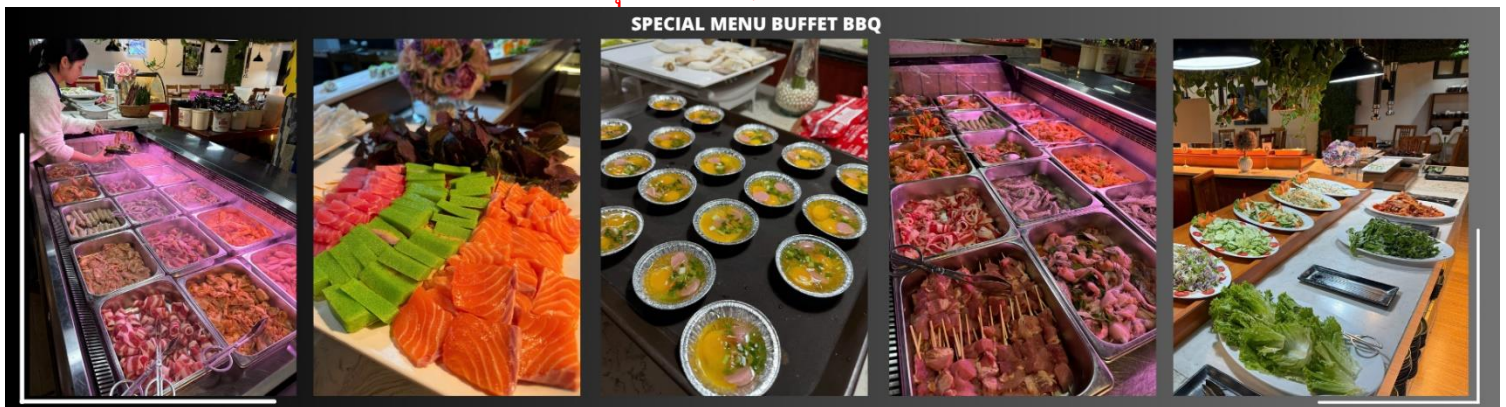
SPECIAL MENU BUFFET BBQ

รับประทานอาหารค่ำ ณ ภัตตาคาร บุฟเฟต์ BBQ (3)