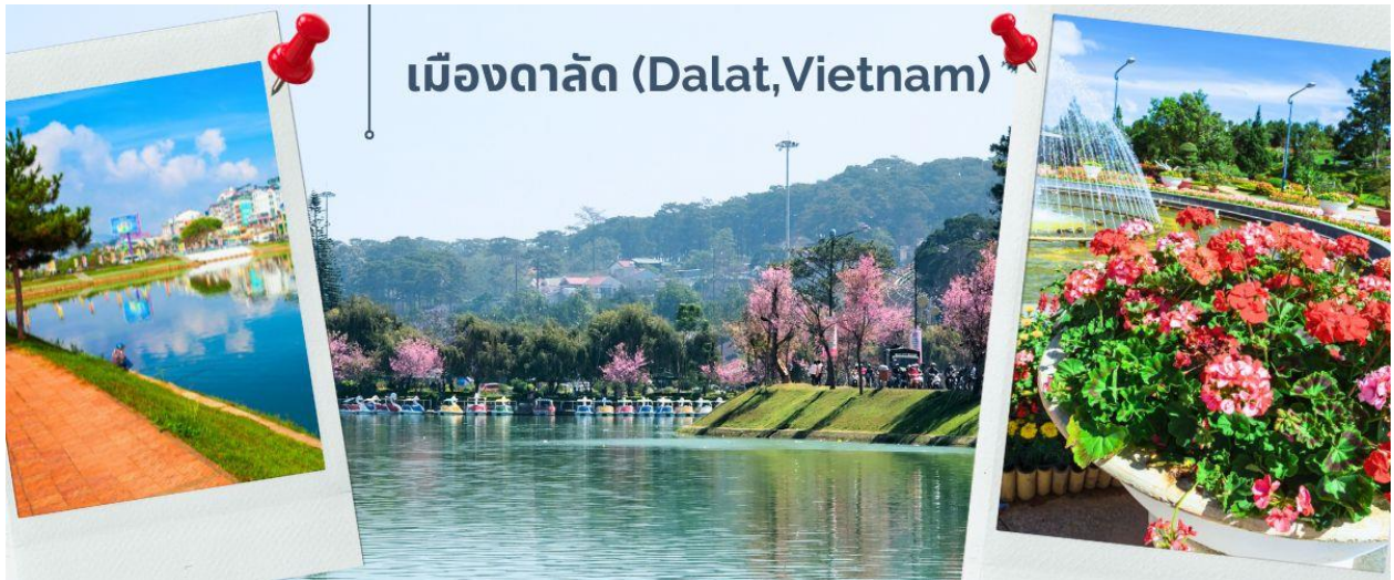
เมืองดาลัด (Dalat, Vietnam)

จากนั้นออกเดินทาง มุ่งหน้าสู่เมืองดาลัด โดยใช้เวลาเดินทางประมาณ 3.30 ชั่วโมง (ระหว่างเส้นทางมีจุดแวะพักรถและจำหน่ายสินค้า) ดาลัดเป็นเมืองหลวงของจังหวัดเลิมต่ง และเป็นเมืองที่ใหญ่ที่สุดในภูมิภาคที่สูงตอนกลางของประเทศเวียดนาม มีความสูงจากระดับน้ำทะเลประมาณ 1,500 เมตร (4,900 ฟุต) มีอากาศเย็น โดยมีอุณหภูมิเฉลี่ย 18 ถึง 25 องศาเซลเซียส อุณหภูมิสูงสุดที่เคยเกิดขึ้นในดาลัด คือ 27 องศาเซลเซียส และต่ำสุดคือ 6.5 องศาเซลเซียส เป็นหนึ่งในเมืองท่องเที่ยวยอดนิยมในเวียดนาม