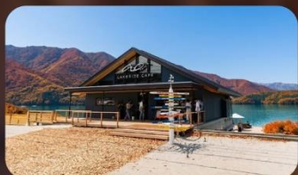
AO Lakeside Cafe'