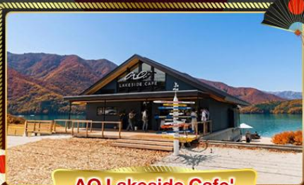
AO Lakeside Cafe'