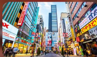
ซ้อปบั้งชินจูกุ