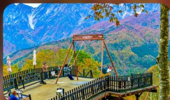
ฮาคุบะอิวาทากะ