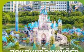
สวนสนุกแก๊งอเตฮาเวิร์ล Lotte Adventure World