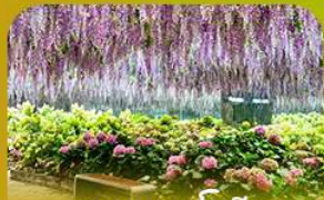
สวนนกเป๊กนือ