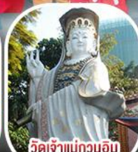
วัดเจ้าแม่กวนอิม รีพัลส์เบย์