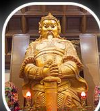
วัดเขangkงหมิว