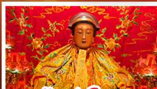
วัดเขาล่งไฉมว