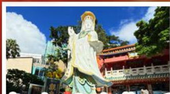
เจ้าแม่กวนอิมรัฟัสส์เบย์