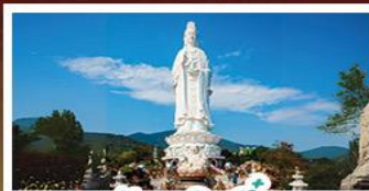
วัดเจดีย์แก้ว