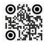
สิทธิประโยชน์เอไอเอ ไวกาลิตี้