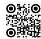
สแกนกับเอไอเอ ไวกาลิตี้

กรุณาศึกษารายละเอียดเพิ่มเติมเกี่ยวกับสิทธิประโยชน์ของสมาชิกที่ https://www.aia.co.th/health-wellness/vitality/rewards