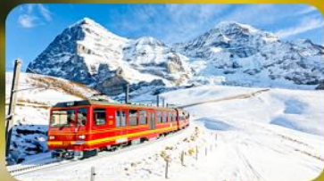
พิชิตยอดเขาจุงเฟรา