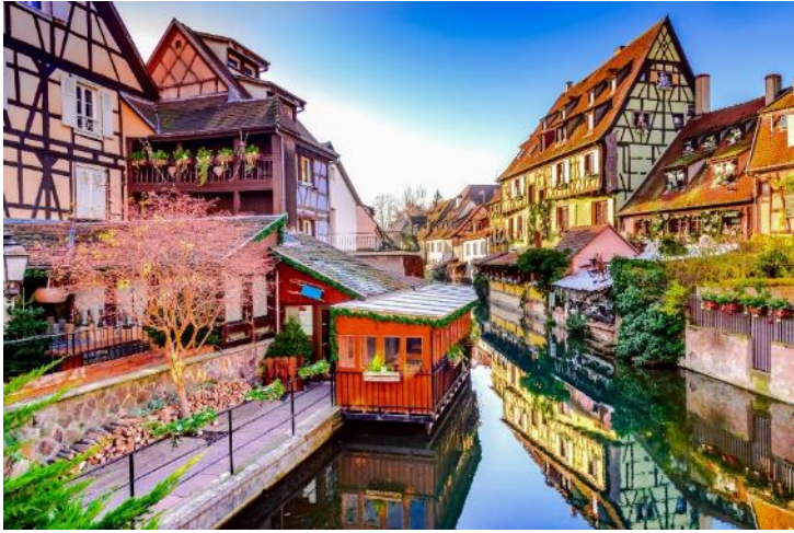
เมืองกอลมาร์ (Colmar)