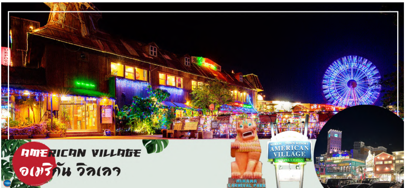
AMERICAN VILLAGE อเมริกัน วิลเลจ

จากนั้นนำท่านสู่ อเมริกัน วิลเลจ (American Village) (ใช้เวลาเดินทางประมาณ 50 นาที) ตั้งอยู่ในเมืองที่มีชื่อว่า ซาตัง อยู่ตอนกลางของโอกินาวา สร้างเลียนแบบแหล่งช้อปปิ้งย่านชานไดเอโกในประเทศสหรัฐอเมริกา ที่นี่เป็นแหล่งช้อปปิ้งที่มีสินค้าสารพัดหลากหลายสไตล์ให้ท่านได้เลือกสรร นอกจากนี้ยังมีสถานที่บันเทิงสร้างความสนุกสนาน เช่น โรงภาพยนตร์, โบว์ลิ่ง, คาราโอเกะ, เกมเซ็นเตอร์, ชิงช้าสวรรค์, ไลฟ์เฮ้าส์, บาร์, ร้านอาหาร, ร้านหนังสือ, ร้านเสื้อผ้า และร้านตัวแทนจำหน่ายตัวเครื่องบิน โรงแรม และชายหาด เรียกได้ว่ามีร้านค้าต่างๆ รวมกันอยู่ที่นี่เกือบทั้งหมด