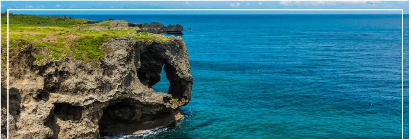
CAPE MANZAMO ผามันซาโมะ

จากนั้นนำท่านเดินทางสู่ ผามันซาโมะ (Cape Manzamo) (ใช้เวลาเดินทางประมาณ 1.20 ชั่วโมง) ผาหินที่สูงชันกว่า 30 เมตรมีลักษณะคล้ายวงช้างหันหน้าสู่ทะเลจีน พื้นที่สีเขียวของต้นหญ้าที่ขึ้นปกคลุมจนถึงยอดหน้าผาดัดกับผืนน้ำทะเลสีฟ้าใส เป็นทิวทัศน์ที่สวยงามที่สุดแห่งหนึ่งในโอกินาวา ในวันที่ท้องฟ้าสดใสจะสามารถ มองเห็นความสวยงามของเกาะทางตอนเหนือและเกาะที่อยู่นอกชายฝั่งได้อย่างชัดเจน ชาวญี่ปุ่นส่วนใหญ่นิยมที่จะมาตั้งวงปิกนิก หรือเล่นกีฬาโปรดของตน ความกว้างใหญ่ของผาหินแห่งนี้ว่ากันว่าสามารถรองรับนักท่องเที่ยวถึง 10,000 คนในเวลาเดียวกันได้อย่างสบายๆ