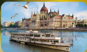
ล่องเรือแม่น้ำดานูบ พร้อมจิบแชมเปญ