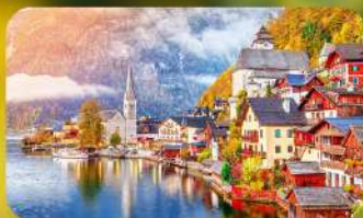
การันตีพัก Hallstatt / St. Wolfgang หรือริมทะเลสาบ 1 คืน