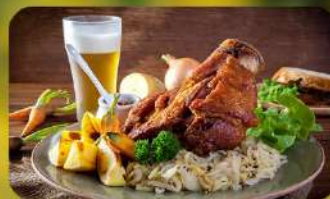
พิเศษ! ลิ้มลองเมนูประจำชาติ ถึง 5 ประเทศ!!!