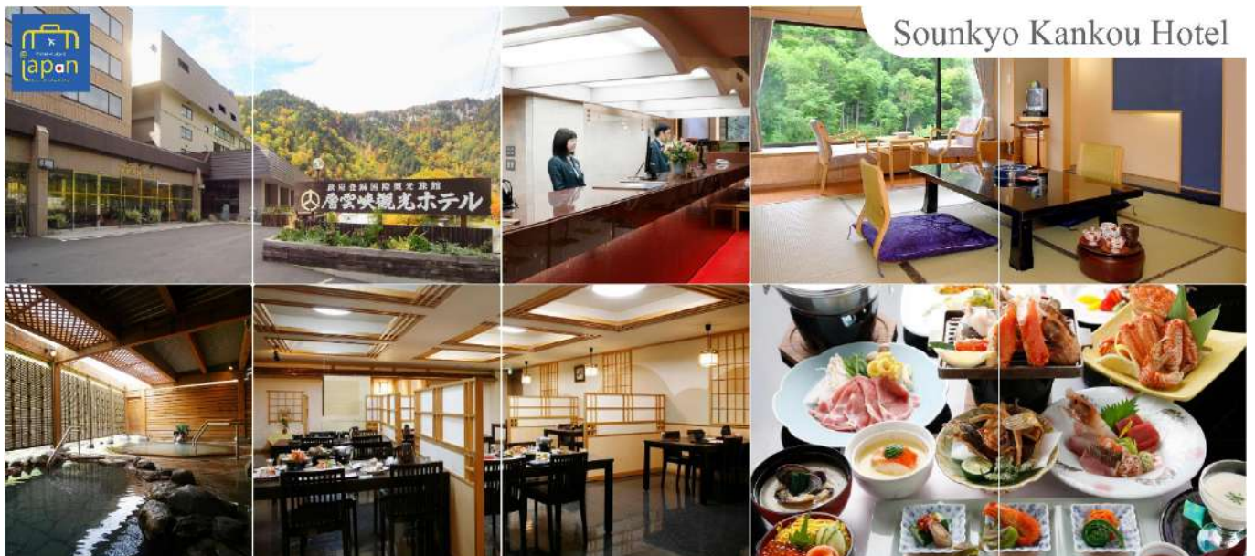
Sounkyo Kankou Hotel

หลังอาหารให้ท่านได้ผ่อนคลายกับการแช่น้ำแร่ธรรมชาติ เชื่อว่าถ้าได้แช่น้ำแร่แล้ว จะทำให้ผิวพรรณสวยงามและช่วยให้ระบบหมุนเวียนโลหิตดีขึ้น