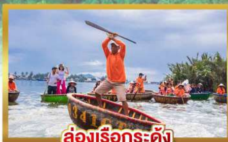
ล่องเรือกระดิ่ง