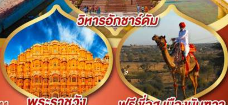
วิหารอักซาร์ดัม