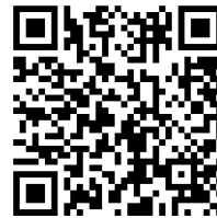
ภาษาอังกฤษ