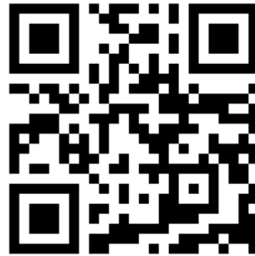
ภาษาอังกฤษ