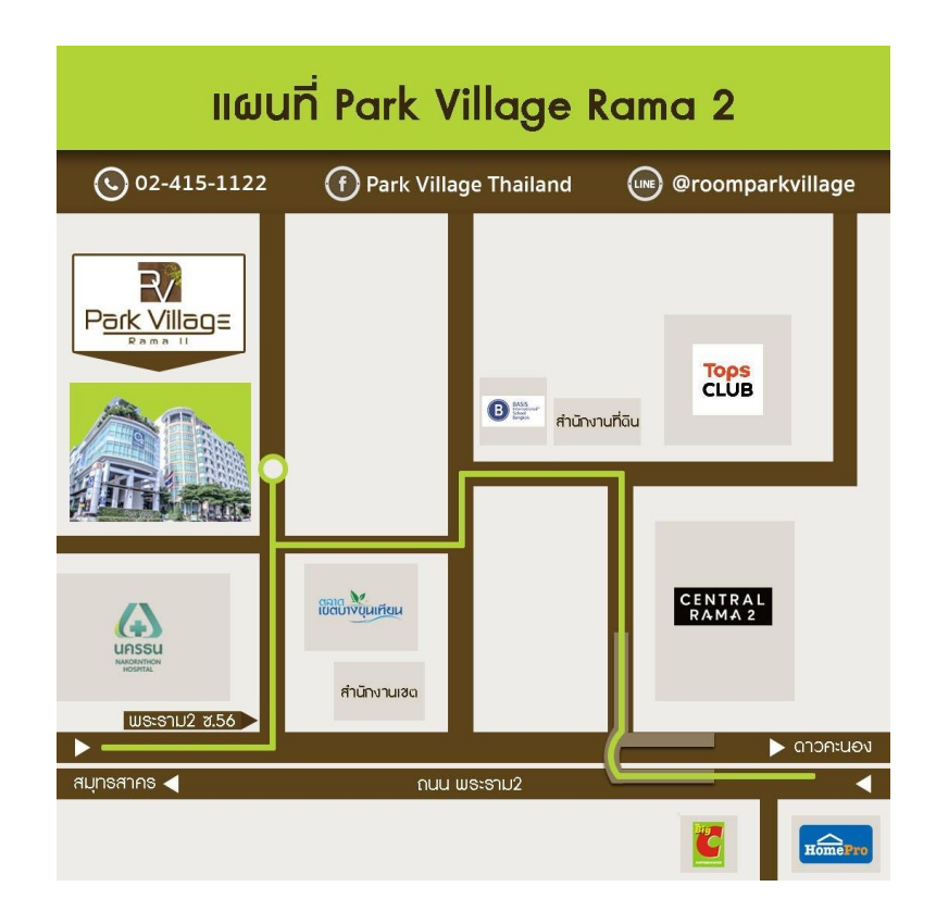
แผนที่ลานจอดรถ 2 และ 3 พาร์ค วิลเลจ พระราม 2