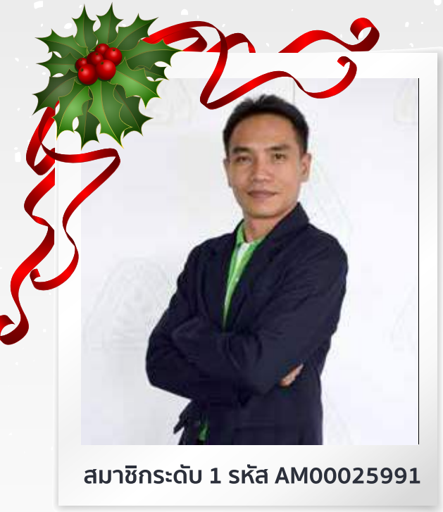
สมาชิกระดับ 1 รหัส AM00025991