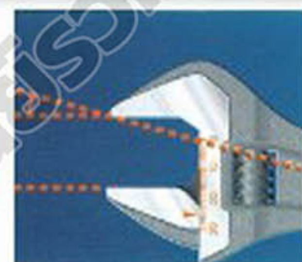
หัวประแจทำมุม 15 องศา ทำให้มีประสิทธิภาพในการใช้งานและเข้าหันทึบมากขึ้น