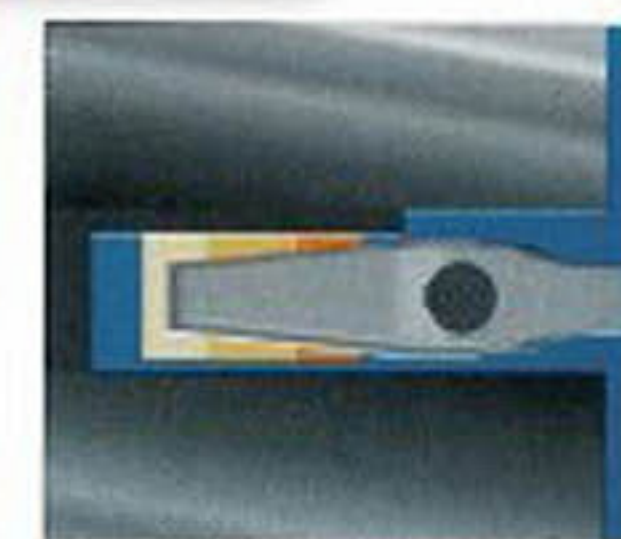
ออกแบบให้มีขนาดกระดัดรัดแข็งแรง สามารถขันในทึบเคบได้ดี