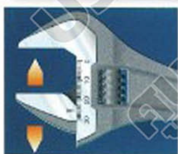
ประแจเลื่อนสามารถปรับขนาดปากตามที่ต้องการได้ง่ายและแม่นยำ