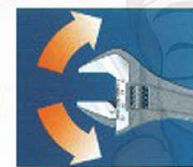
หัวประแจเลื่อนแข็งแรงทนทานต่อการใช้งานขึ้นได้ทั้งชายและชวา