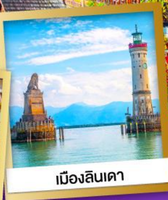
เมืองลินเดา